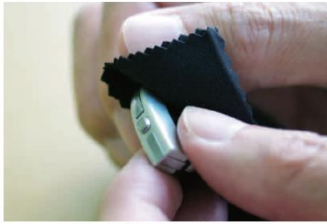
付属のクロスで表面の汚れを拭き取ります。