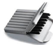
●ナノケアワックスガード (8本入り)