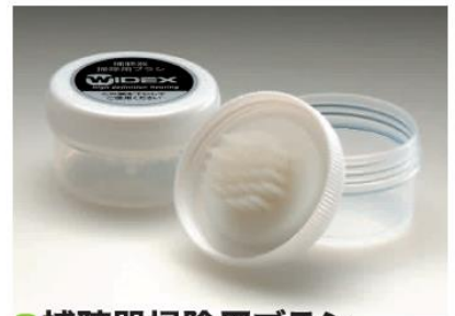
●補聴器掃除用ブラシ