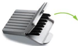
交換用ナノケアワックスガード

使用中のナノケアワックスガードをはずし、音の出口を軽くブラッシングをしてから新しいものを取り付けます。