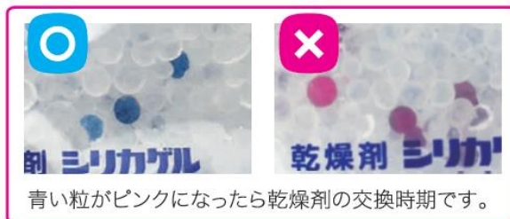
青い粒がピンクになったら乾燥剤の交換時期です。