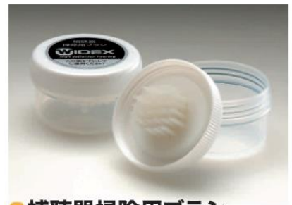
●補聴器掃除用ブラシ