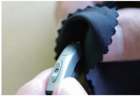
付属のクロスで表面の汚れを拭き取ります。