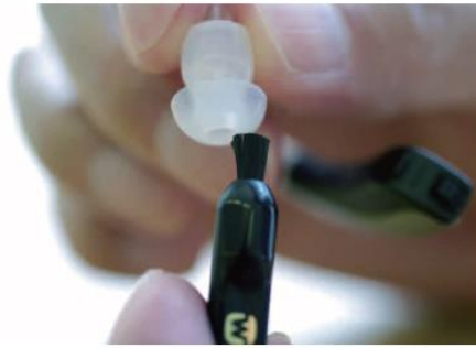
付属の掃除用ブラシを使って音の出口を下に向けてブラッシングします。

イヤモールドや耳せんも1ヶ月に1回は洗浄しましょう。専用のクリーナーのご使用をおすすめしますが、ない場合は、就寝時に補聴器本体からはずして(石鹸を入れた)水やぬるま湯につけておくだけで汚れが落ちやすくなります。チューブの中に入った水は、エアブローを使って吹き飛ばします。